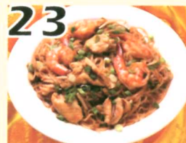
23 Pad thai $10.75