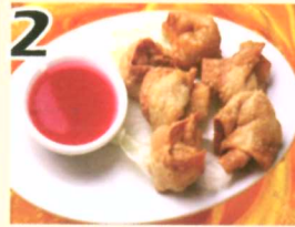
2 Wonton Frits (6) $3.95