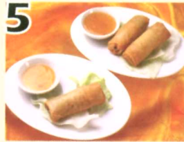
5 Rouleaux (1) $1.75 impériaux (2) $2.95