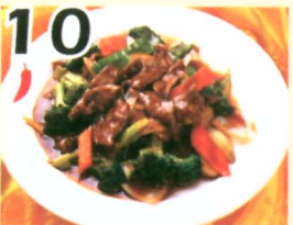
10 Bœuf Hunan $11.95