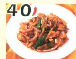
40 Poulet à la sauce Szechuan $11.45