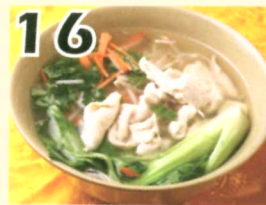
16 Soupe aux nouilles avec poulets $7.65