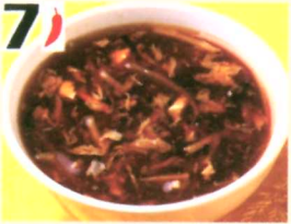
7 Soupe aigre-piquante $2.95