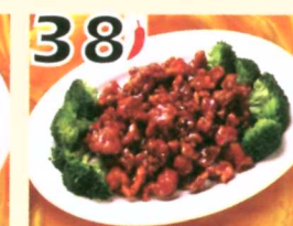
38 Poulet général Tao $10.45