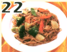
22 Pad thai aux légumes $9.75