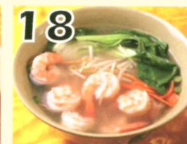
18 Soupe aux nouilles avec crevettes $8.25