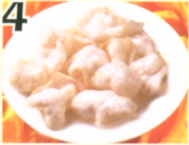
4 Croustilles de crevettes $2.95