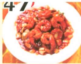
47 Crevettes grillées $13.45