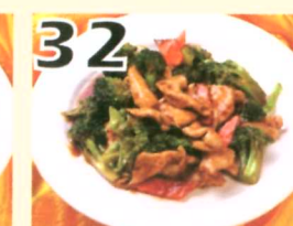
32 Poulet sauté avec Brocoli chinois $10.95