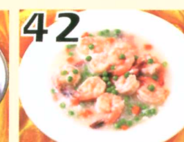
42 Crevette avec sauce Homard $13.45