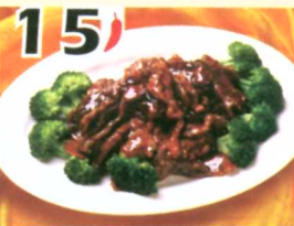
15 Bœuf à l'orange $11.95