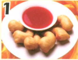
1 Crevettes tempura (6) $6.95