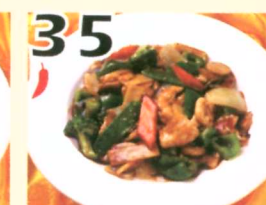
35 Poulet Hunan $10.95