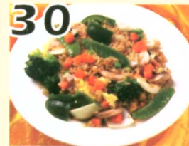
30 Riz frit aux légumes $7.95