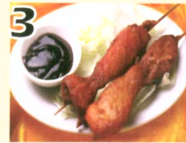
3 Brochettes de Poulets(2) $4.95