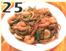
25 Lo mein aux crevettes $11.45