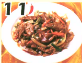
11 Bœuf au style szechuan $11.95