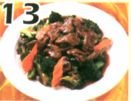
13 Bœuf sauté au brocoli chinois $11.45