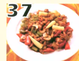
37 Poulet sauté avec noir d'acajous $11.45