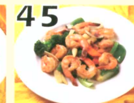
45 Crevettes sautées aux légumes $12.95