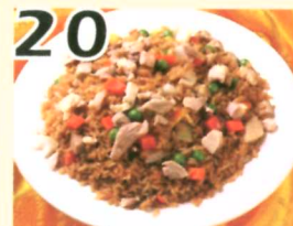
20 Riz frit aux poulets $7.95