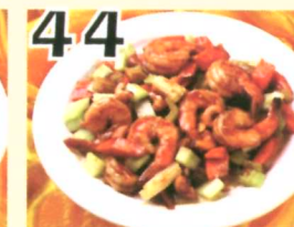
44 Crevettes sautées avec noix d'acajous $13.45