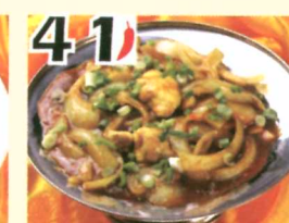
41 Poulet à la sauce cari $11.45