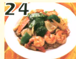
24 Chow mein cantonnais $12.45