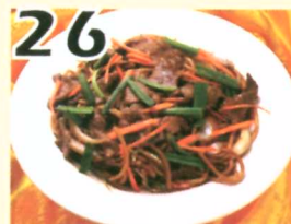
26 Lo mein aux bœufs $10.45