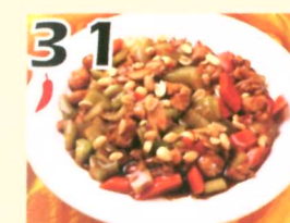
31 Poulet Kung Pao $11.45