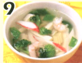
9 Soupe aux fruits de mer et tofu $3.95