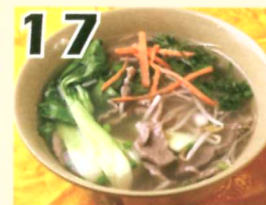
17 Soupe aux nouilles avec bœufs $7.65