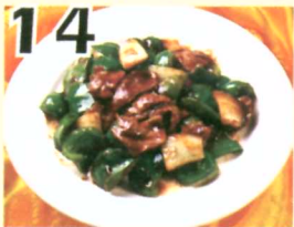
14 Bœuf sauté avec poivron vert $11.45