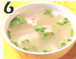
6 Soupe Wonton $2.95