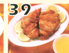
39 Poulet au citron (2) $10.95