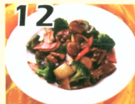
12 Bœuf sauté aux légumes $11.95