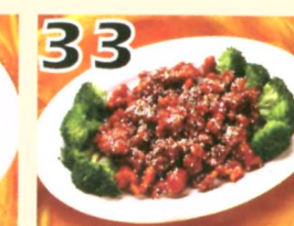
33 Poulet sésame $10.95