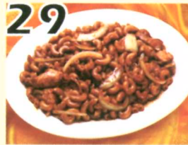
29 macaroni aux poulets $8.95