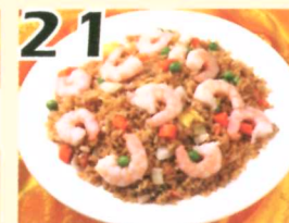
21 Riz frit aux crevettes $8.95