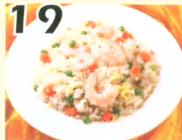
19 Riz frit au style Yong Chow $8.95