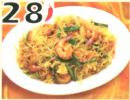
28 Vermicelle sautée aux style Singapour $12.45