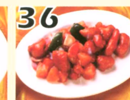
36 Poulet aigre-douce $10.45