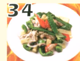
34 Poule sauté aux légumes $10.95