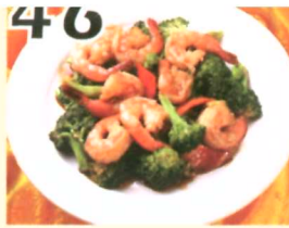
46 Crevettes sautées au brocolis chinois $12.95