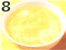
8 Soupe aux œufs $2.95