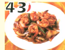
43 Crevettes au style Szechuan $12.95