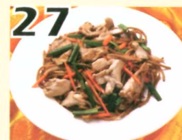
27 Lo mein aux poulets $10.45